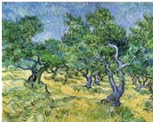
"Bosque de oliveira (1889) Vincent Van Gogh Cores frias

Exemplos de obras famosas utilizando Cores Quentes e Frias