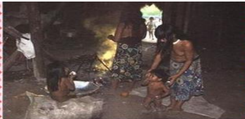
As crianças indígenas aprendem observando os adultos. Indígenas Kalapalo, Aldeia Aiwa – Parque Indígena do Xingu – MT, 2009.

É ASSIM QUE A GENTE ENSINA: ENSINA O MENINO A MATAR PEIXINHO. ENSINA A MENINA A SOCAR NO PILÃO. ENSINA O MENINO A FLECHAR PASSARINHO. ENSINA A MENINA A FIAR ALGODÃO.