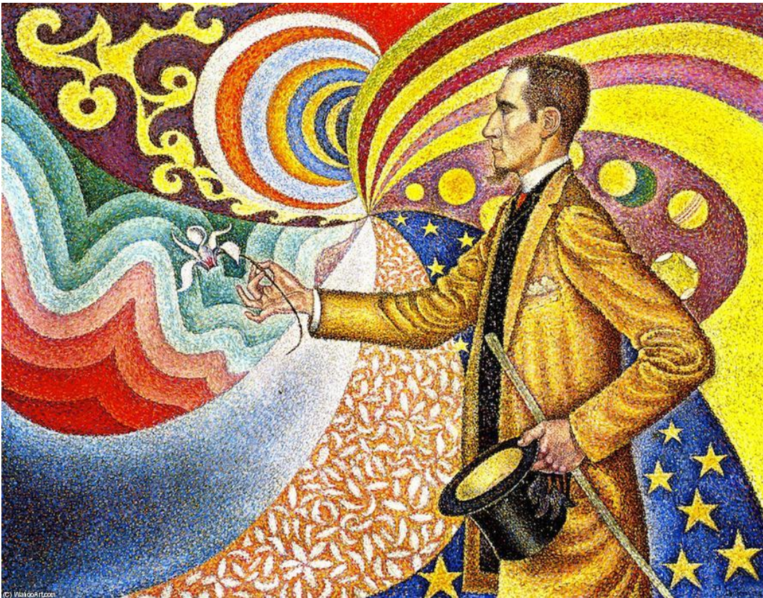
Retrato de Felix Fééon, 1890 (Paul Signac)