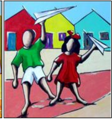
Aviãozinho de papel