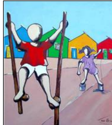
Perna de pau e pé de lata II