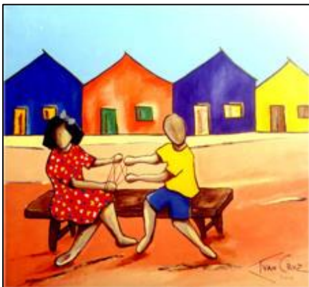
Cama de gato II