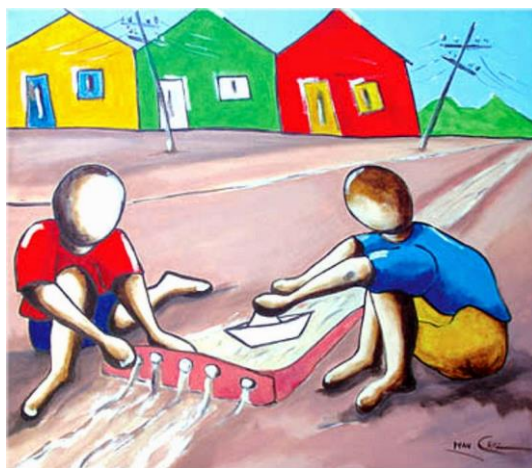
REPRESA E BARQUINHO DE PAPEL

OBSERVE QUE AS DUAS BRINCADEIRAS ACIMA POSSUEM ALGO EM COMUM: O BARQUINHO DE PAPEL!