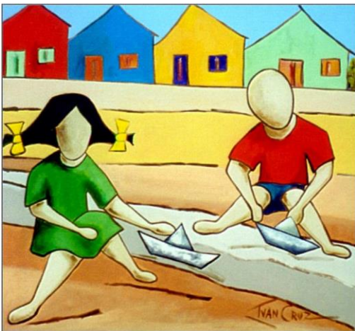
BARQUINHO DE PAPEL

OBSERVE AS OBRAS “BARQUINHO DE PAPEL” E “REPRESA E BARQUINHO DE PAPEL” DO ARTISTA IVAN CRUZ