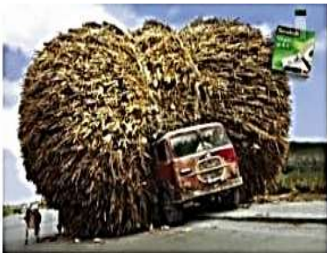
1985 – Anúncio de fita adesiva