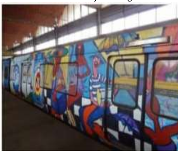
2015 – Anúncio de cerveja em vagões de metrô.