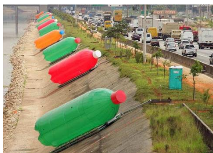
Garrafas pet gigantes no Tietê