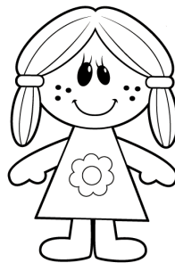
Boneca: 40 reais