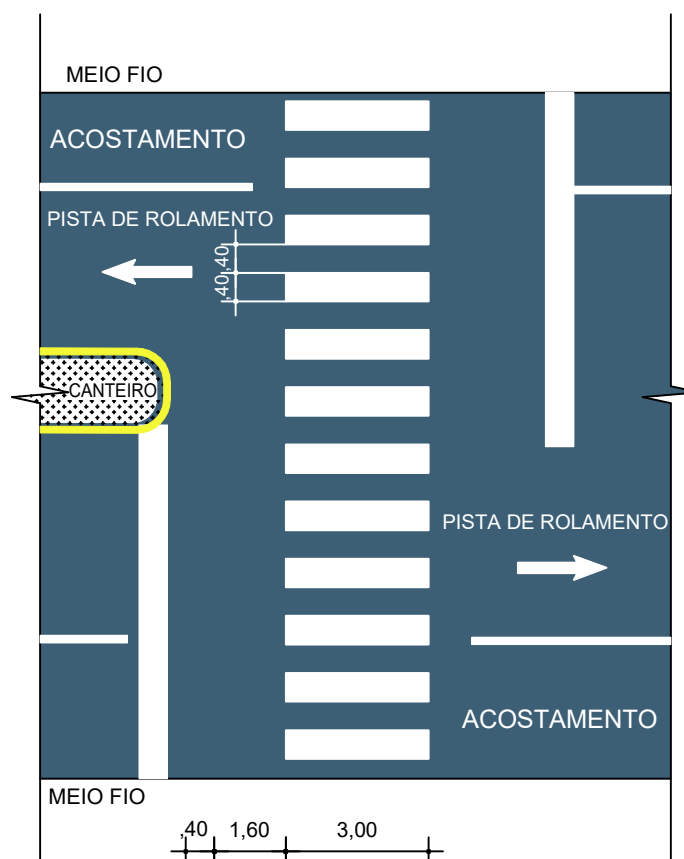
DETALHE FAIXA DE SEGURANÇA P/PEDESTRES ESCALA: RELATIVA