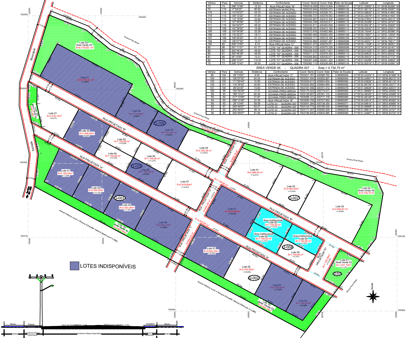
PLANTA DA SEÇÃO TRANSVERSAL ESCALA: RELATIVA

NÚMERO DE LOTES _____ 33 un. NÚMERO DE QUADRAS _____ 07 un.